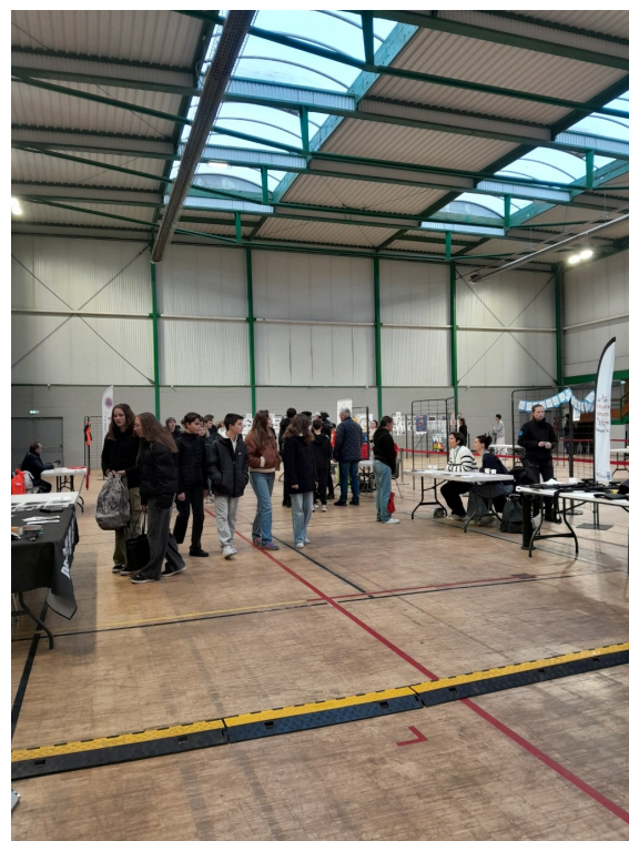
Arrivée des premiers collégiens

Entre 350 et 400 élèves des collèges et lycées environnants ont participé à cette journée organisée par la municipalité de Pont-Audemer sous l'égide de Madame DUTILLOY, adjointe au maire. De nombreux stands : gendarmerie, armée de l'air, marine et armée de terre, protection civile et police nationale et municipale étaient présents pour accueillir tous ces jeunes. Nous étions invités à y participer.